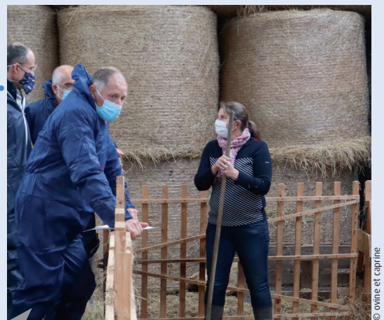
La visite d'exploitation est un moment privilégié de partage et d'échanges

« Ma première réunion de secteur en 2018 m'a fait découvrir l'utilité de la section ovine du GDS Manche. Depuis, j'ai pu bénéficier de formations et d'aides au diagnostic, qui m'ont permis d'améliorer la conduite sanitaire de mon élevage. Les réunions de secteurs, toujours dans le partage, m'ont donné envie de m'investir. Éluë depuis 3 ans, je participe activement au développement de la section et, surtout, je fais entendre votre voix auprès du GDS. »