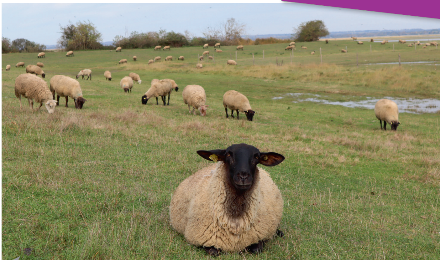
Vers des méthodes alternatives de contrôle des vers digestifs

Si vous êtes intéressé, ne tardez pas à vous inscrire à ces formations.