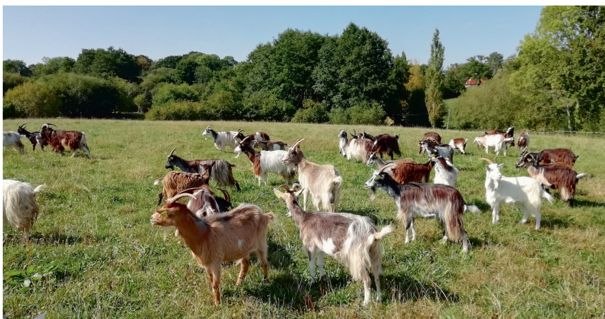
Les résistances aux vermifuges ne sont pas rares chez les caprins.

L'utilisation exclusive des vermifuges pour la gestion des strongles digestifs est donc une impasse. À terme