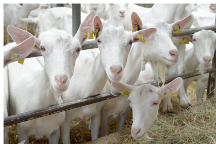
Le nouveau référentiel CAEV permet la vente de caprins à statut favorable.