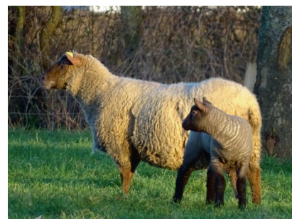
Faites du sanitaire un atout majeur pour votre élevage !

C'est simple, il suffit de nous contacter et/ou de remplir le coupon ci-dessous et nous établirons une nouvelle adhésion. Vous pouvez bénéficier de toutes ces nouvelles offres pour seulement 6 € supplémentaires de forfait et 0,45 € de plus par reproducteur .